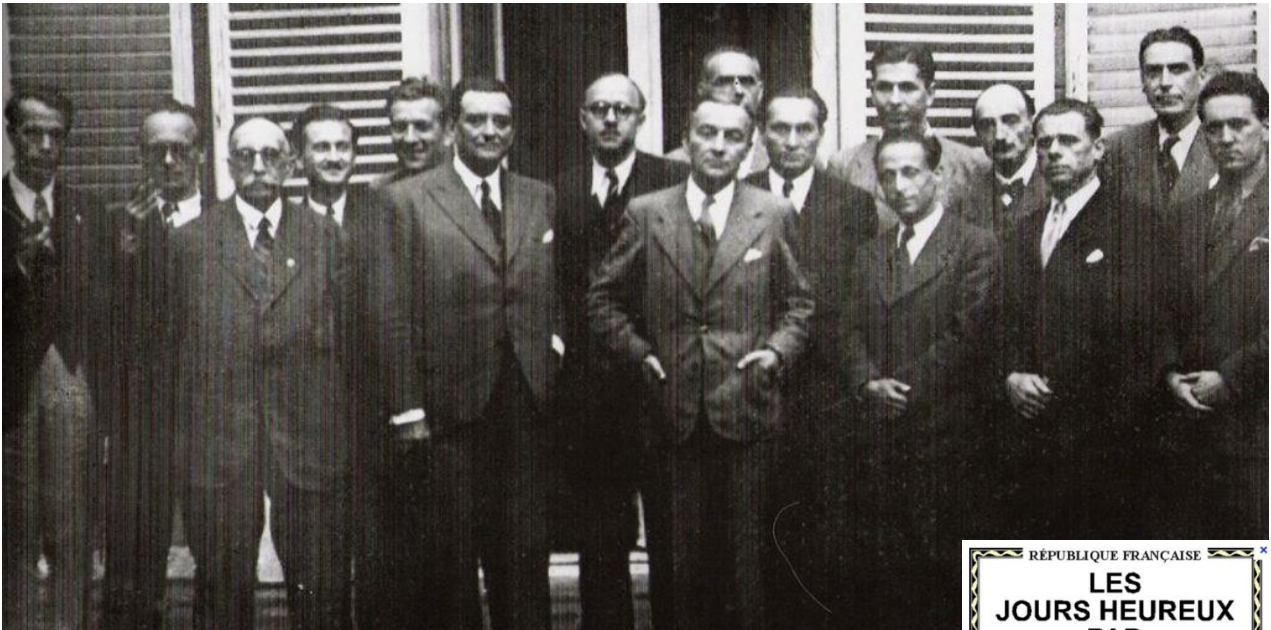
Le Conseil National de la Résistance à la libération

L'une de leurs prérogatives est la gestion des activités sociales .